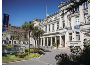
Queen Mary University of London (145位)