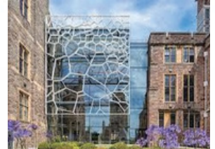
University of Bristol (61位)