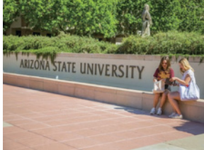
Arizona State University (179位)