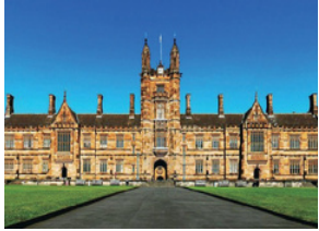
The University of Sydney (19位)