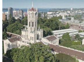
The University of Auckland (85位)